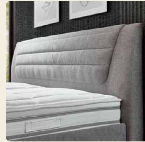
Kopfteile mit individueller Optik.