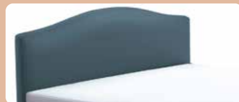
KT 0334, Höhe ca. 106 cm