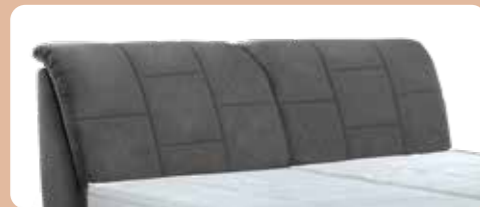
KT 0864, Höhe ca. 110-124 cm, KV gegen Aufpreis