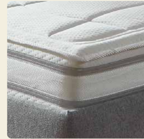
Marken-Bezug mit eingearbeitetem Klimaband.