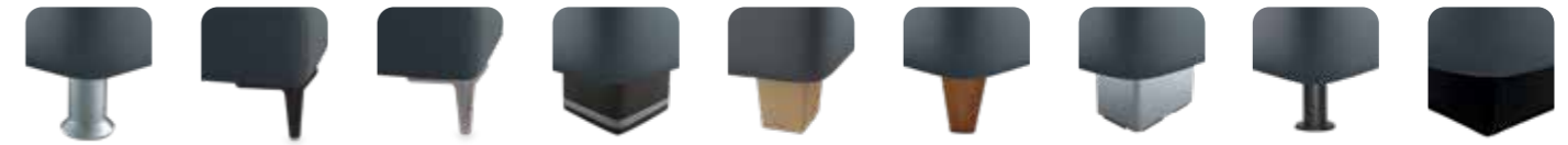
K 01-10 K 01-15 Kunststofffuß alufarbig