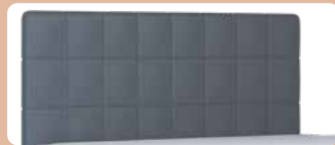
KT 0046 S / M / L / XL, Höhe ca. 99 / 109 / 119 / 129 cm

Das Polsterbett-System MONDO Luvara verfügt über vielfältige Gestaltungsmöglichkeiten. Aus einem Baukastensystem mit 8 Kopfteil-Varianten, 4 Bettkastenformen und 9 Fußformen können Sie unmittelbar die Optik Ihres Wunschbettes bestimmen. Darüber hinaus entscheiden Sie über die Größe und Höhe, alles ist möglich. Auch für den Bezug steht Ihnen eine umfangreiche Auswahl zur Verfügung. Das Bett ist sowohl in Stoff als auch in einer Lederalternative und in vielen attraktiven Farben lieferbar.