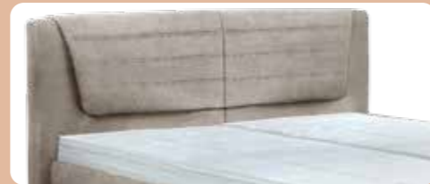
KT 0863, Höhe ca. 109 cm