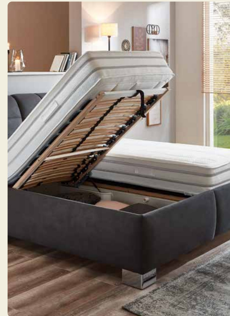
Der Bettkasten bietet hervorragende Stauraummöglichkeit.

Kunststoff-Fuß alufarbig, Bezugsmaterial Brego silber