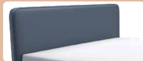
KT 0383, Höhe ca. 116 cm