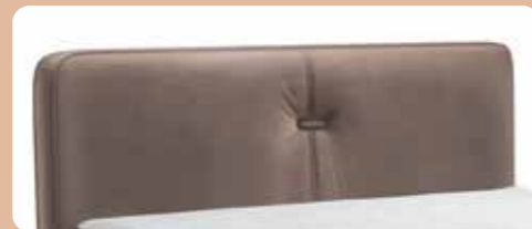
KT 0865, Höhe ca. 125 cm