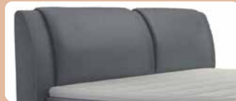
KT 0327, Höhe ca. 108 cm